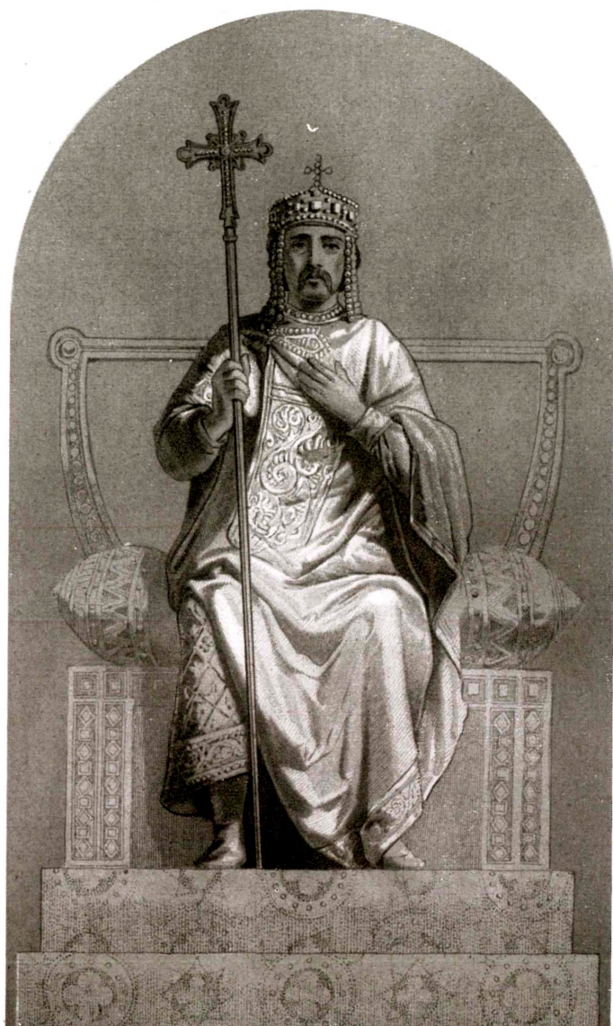
Святой Володимир Великий