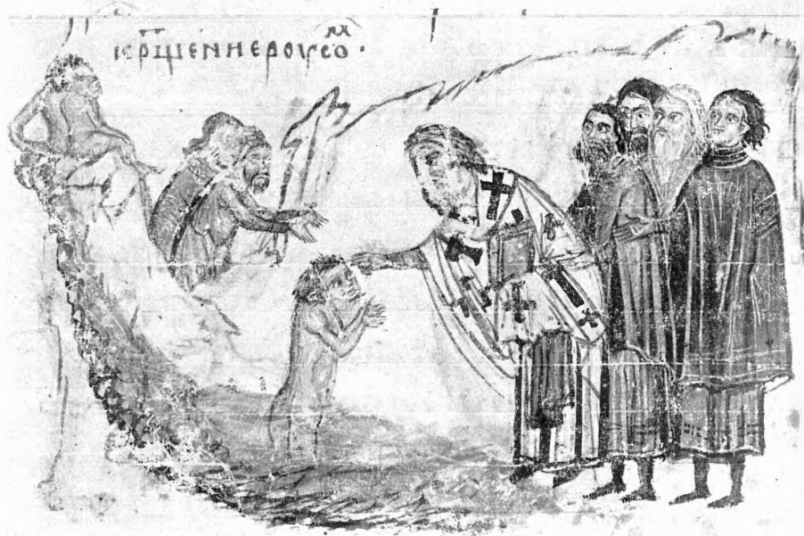
Зображення хрищення Болгарії і України в рукопису т. зв. хроніки Мануссії з XIV ст. (болгар. редакції) (Bibliotheca Vaticana, Codex Slav., nr. 2, fol. 163 v i 166 v.)