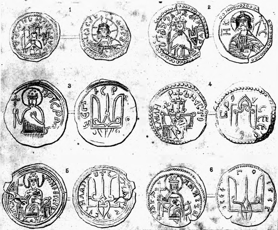
Монети вел. кн. Володимира Великого, по реконструкції І. І. Толстого