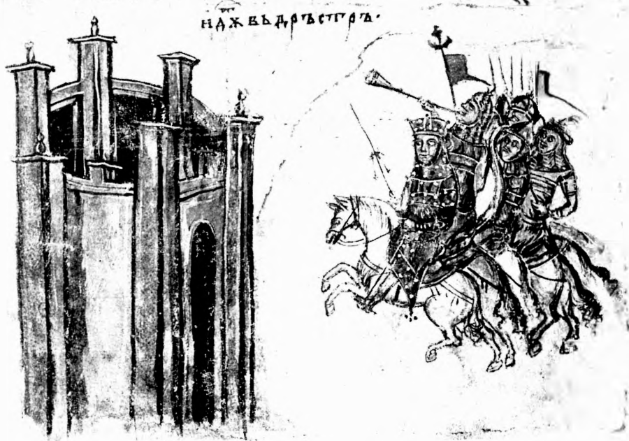
Похід Святослава Ігоревича на болгарів (Із хроніки Манасії; Bibl. Vat., Cod. Slav., 2, fol. 178 v.)