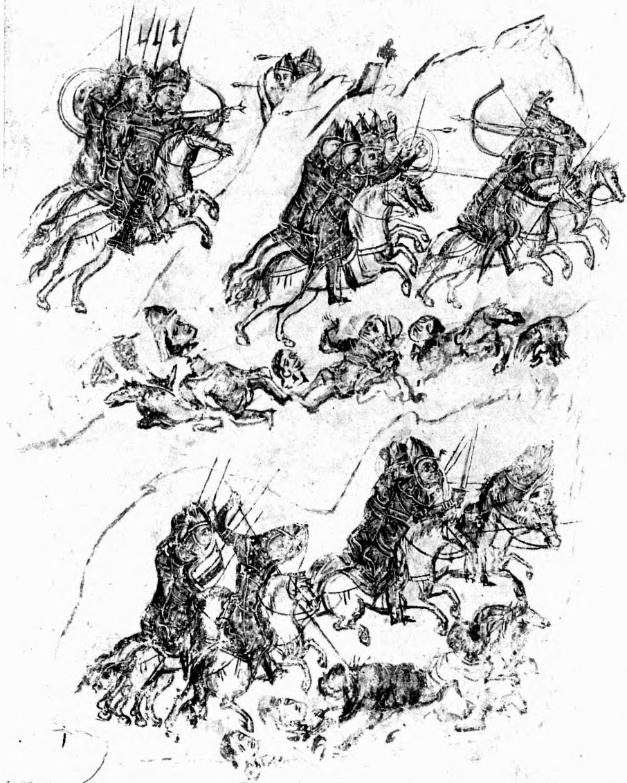
Похід Святослава Ігоревича на болгарів (Із хроніки Манасії; Bibl. Vat., Cod. Slav., 2, fol. 174)