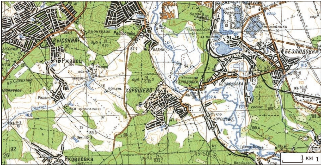
Рис. 1. Місце розташування скарбу біля снт Хорошеве: 1 – топографічна карта (за картою Генштабу, М-37-73); 2 – карта-схема (wikimaria.org, 49°51.79809'N, 36°12.76522'E); 3 – на основі © Maxar Technologies