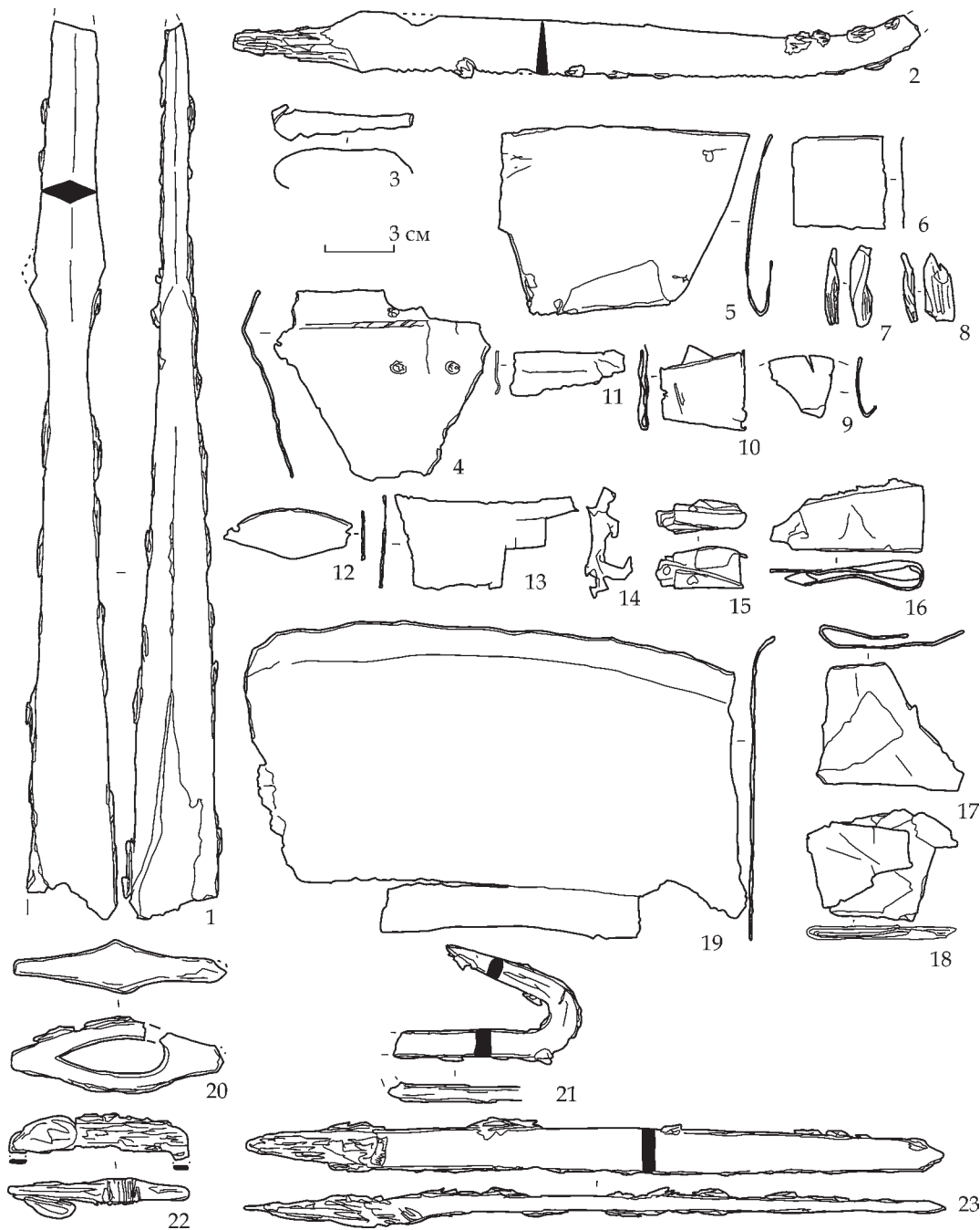
Рис. 3. Склад скарбу: 1, 2, 20–23 – залізні предмети; 3–19 – бронзовий брут

ручки. На частині пластин спостерігаються сліди їх різання спеціальними ножицями (рис. 3: 3, 6, 13, 14). Подібні платівки від бронзового казана у якості сировини були присутні у скарбі середини – другої половини VII ст., нещодавно знайденого біля с. Мина Долина на Харківщині (Колода, Скиба, 2021, рис. 4: 1). Власне бронзові казани та бронзові днища від залізних клепанних казанів добре представлені у поховальних пам'ятках салтівської культури басейну Сіверського Дінця (Аксенов, Михеев, 2003, рис. 6: 15, 20; Колода, 2015, с. 105–106, рис. 4: 4; Колода, Аксенов 2020, с. 82–83, рис. 3: 1–3).