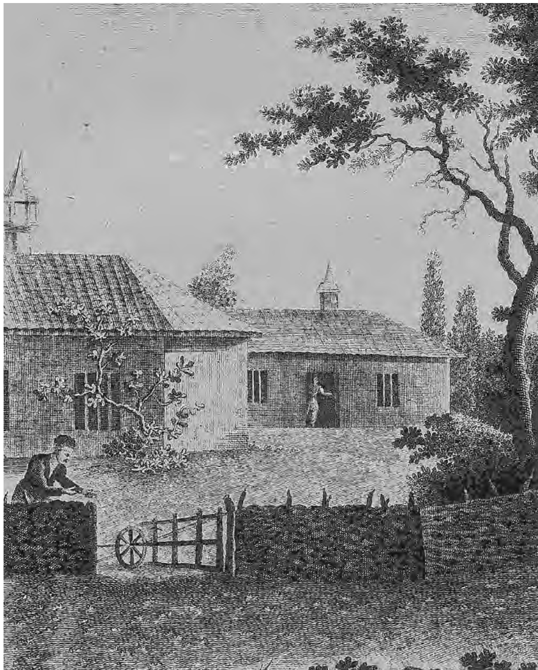
Мал. 2. Гравюра XVIII ст.

1. Озенбашлы Э. Крымцы. Сборник работ по истории, этнографии и языку крымских татар. — Акмесджит, 1997.