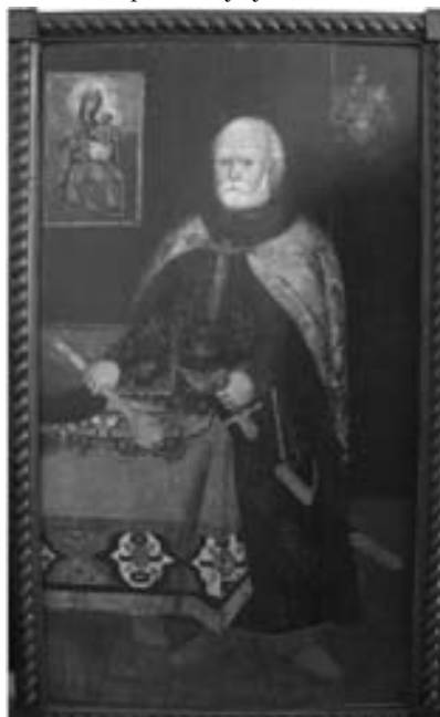
Портрет В. А. Дуніна-Борковського. Поч. XVIII ст.

Інтерес до вивчення українського килимарства з'явився у другій половині XIX – на початку XX століть. Тут треба назвати імена таких авторів, як Є. Кузьмін, В. Піщанський, А. Зарембський, В. Крижанівський, В. Щербаківський. Після Другої світової війни побачили світ окремі праці про українське килимарство А. К. Жука [4] та Я. П. Запаска [5]. Окрему статтю українським килимам XVII – XVIII століть присвятив С. А. Таранушенко. Він звернув увагу на їх зображення у живописних портретах представників козацької старшини, в тому числі і на ті, що пов'язані з чернігівським краєм. Згадав автор і про велику кількість килимів у чернігівській оселі Павла Полуботка, його власну килимарську майстерню в селі Михайлівці поблизу Лебедина та килим з гербом власника з цієї ж майстерні. На думку С. А. Таранушенка, згаданий виріб був ворсовим (ним виконали візерунок), а тло було зроблено двобічним [14]. Нову сторінку в дослідженні