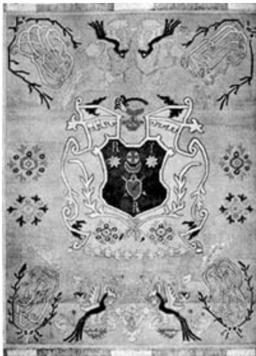
Килим з гербом П. Полуботка. Акварель В. Г. Кричевського. 1913 р.