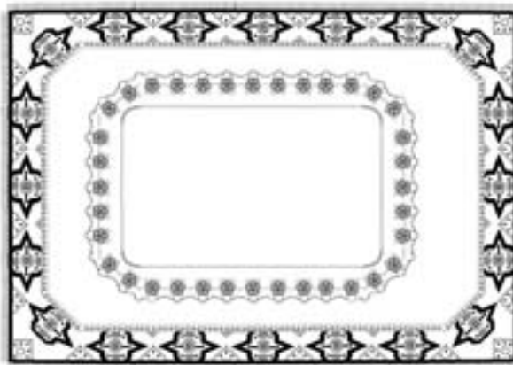
Спроба реконструкції килима з портрета В. А. Дуніна-Борковського. Комп'ютерна графіка О. Потапенко.

Розвиток килимарства в Україні зазначеного періоду був зумовлений широким